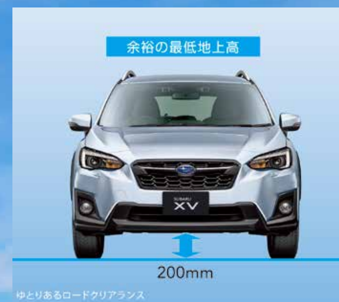
ゆとりあるロードクリアランス

さまざまな道を力強く、かつ安心して走破できるSUVを目指して。SUBARU XVはSUVとして十分な200mmの最低地上高を確保。雪道をはじめ、未舗装路などのアウトドアシーンでも余裕の走破性を発揮します。シンメトリカルAWDがもたらす走行安定性に優れた走りやX-MODEが高める悪路走破性と相まって、乗る人の行動範囲を広げる本格的な性能を備えています。